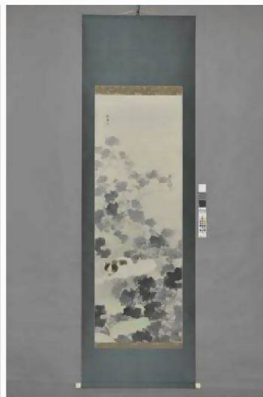
各 縦134cm×横47cm 紙本