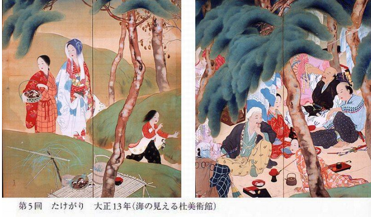
第5回 たけがり 大正13年(海に見える杜美術館)