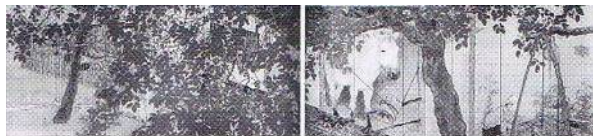
第9回 うまや 大正4年