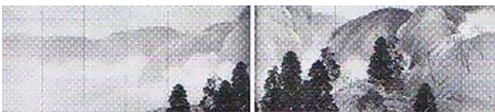
第12回 暮雲 大正7年