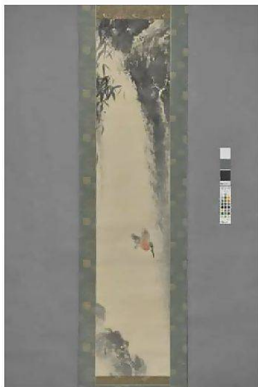
各 縦134cm×横28cm 紙本