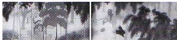
第11回 孟宗藪 大正6年