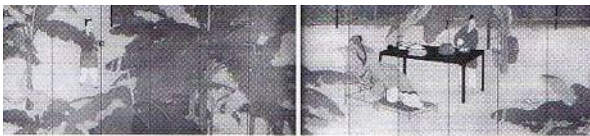
第8回 涼意 大正3年