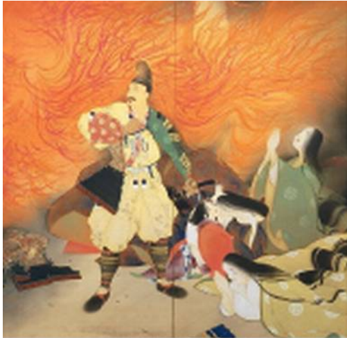
第8回 灰燼 昭和2年(愛知県立美術館)