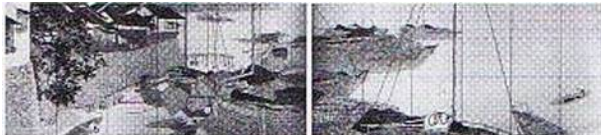
第10回 港頭の夕 大正5年