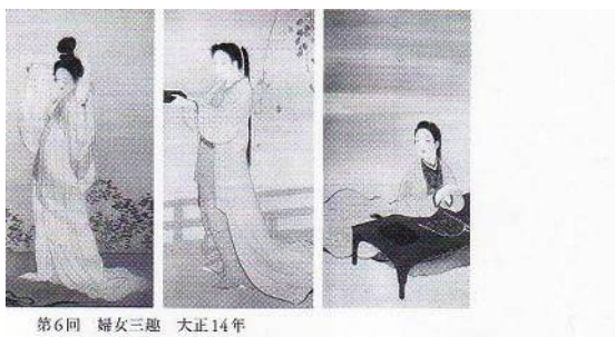
第6回 婦女三題 大正14年