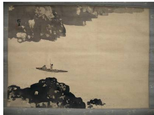
・木曾路の雪 Kagedo Gallery (Seattle, Washington)