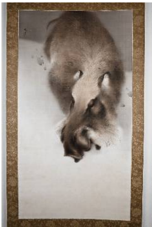
・弓張月 Kagedo Gallery (Seattle, Washington)