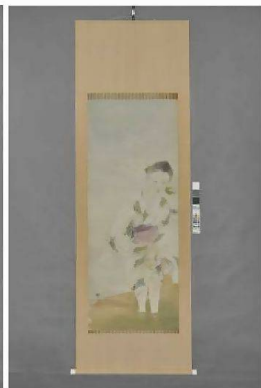
各 縦123cm×横51cm 絹本