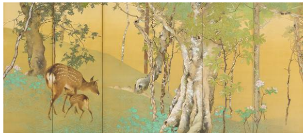
・峡中漁船の図 大英博物館 (London, 英国)所蔵