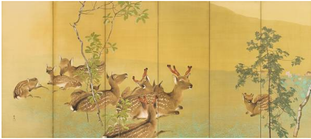
・雪中老猪図 クワック日本美術・文化研究センター (Hanford, California)所蔵