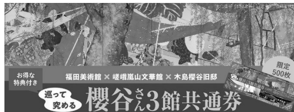
2021年度 公開入場者数

2021年度(令和3年度)の通年の公開入場者は以下の通り。10月23日からの一般公開は福田美術館、嵯峨嵐山文華館の「究めて魅せたおうこくさん」展と連携しての公開し1,339人が、春の公開で374人が入場。